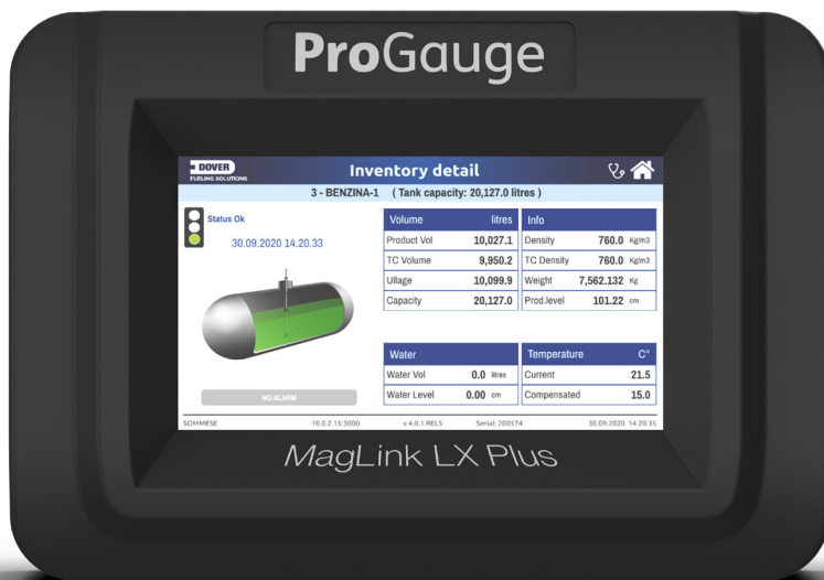
ProGauge MagLink LX Plus

Die ProGauge MagLink LX Plus Konsole ist mit einem brillanten 7-Zoll-Farbdisplay mit intelligenter „Touch-and-Swipe“-Technologie ausgestattet. MagLink LX Plus ist eine Konsole, die für den Einsatz in größeren Dimensionen konzipiert ist. Mit einer Basisüberwachung von bis zu 12 Sonden (in Verbindung mit der patentierten Multi-Drop-Technologie, die die Installationskosten senkt), kann diese Konsole problemlos um eine kontinuierliche statistische Leckererkennung (CSLD), eine elektronische Druckleitungsleckererkennung (PLLD), Relais oder Eingangsanschlüsse und bis zu 48 Sensoren erweitert werden.