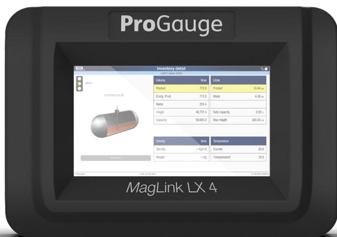
ProGauge Maglink LX

MagLink LX è una soluzione ricca di funzionalità basata su una piattaforma Linux che offre configurazioni flessibili per l'utilizzo in una varietà di configurazioni di alimentazione, sia cablate che wireless. Questa console è in grado di gestire fino a 32 sonde senza sforzo. Un'interfaccia utente basata sul Web è facile da seguire consente all'operatore di accedere rapidamente a una varietà di menu semplificati. Sono supportate più interfacce POS (Point of Sale).