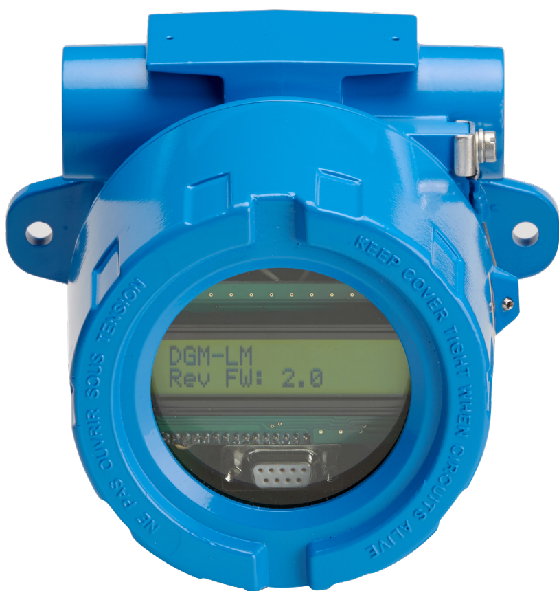
Digimon LCD Atex