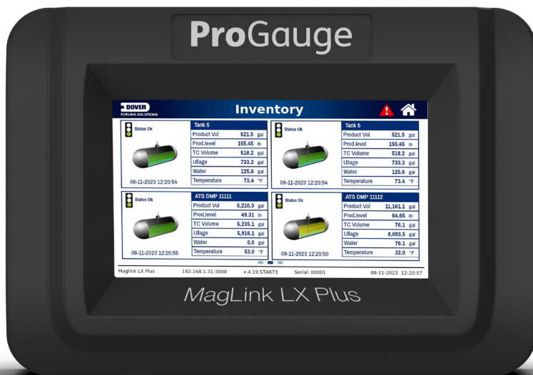
ProGauge MagLink LX Plus

La console ProGauge MagLink LX Plus est équipée d'un écran couleur brillant de 7 pouces doté de la technologie intelligente "touch and swipe". La console MagLink LX Plus est conçue pour être mise à l'échelle. Avec des capacités de monitoring de base allant jusqu'à 12 sondes (couplées à la technologie multi-points brevetée, qui réduit les coûts d'installation), cette console peut être aisément améliorée pour ajouter la Détection Statistique Continue de Fuites (CSLD), la Détection Electronique de Fuites sur Ligne Pressurisée (PLLD), des relais ou des connexions d'entrée, et jusqu'à 48 sondes.