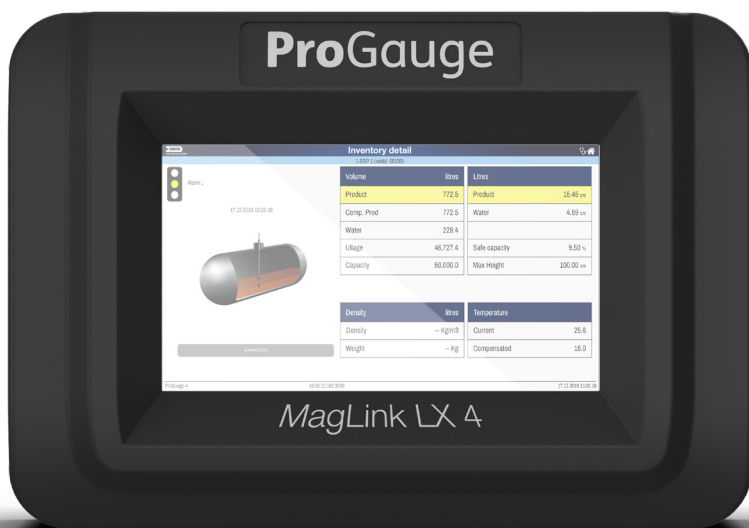
MagLink LX 4 ProGauge